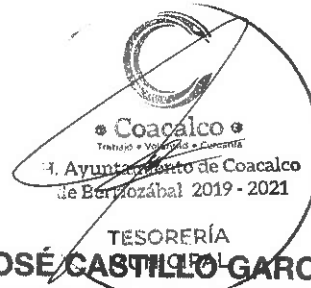
C. JOSÉ CASTILLO GARCÍA TESORERO MUNICIPAL DE COACALCO DE BERRIOZÁBAL

Esta hoja de Firmas es parte integrante del Convenio de Colaboración que suscribe el H. Ayuntamiento de Coacalco de Berriozábal, Estado de México y el Centro de Control de Confianza del Estado de México de fecha tres de marzo del año dos mil veinte.